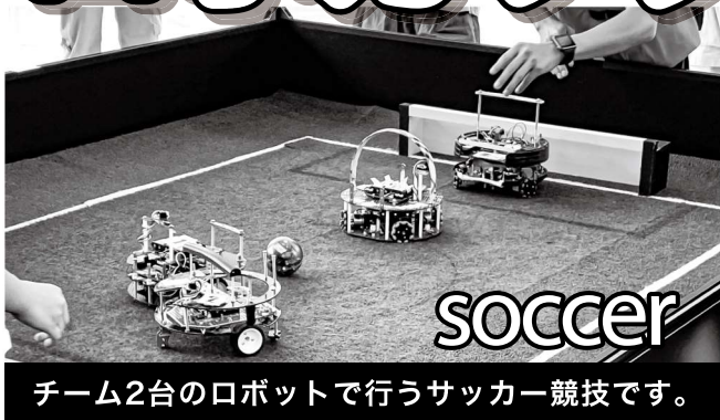
チーム2台のロボットで行うサッカー競技です。